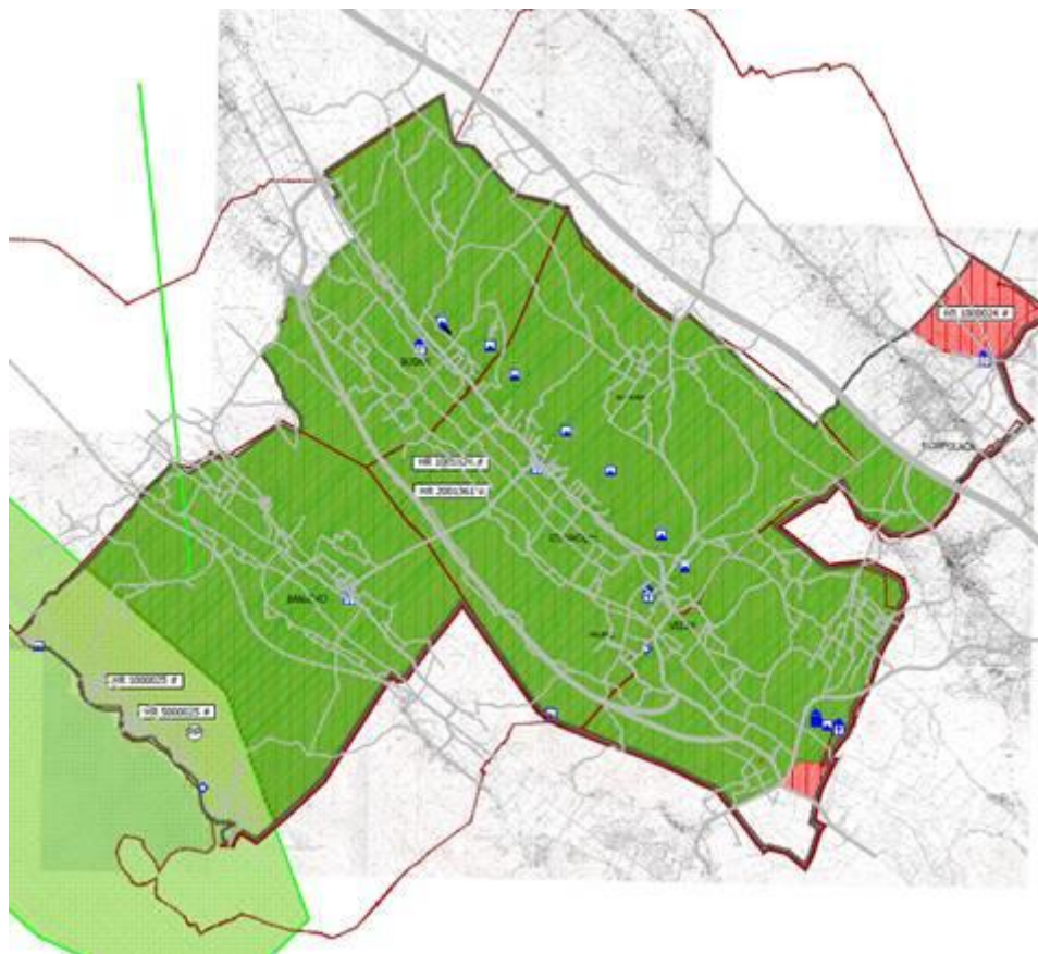
KRAJOBRAZ — POTEZ ZNAČAJAN ZA KRAJOBRAZNU VRIJEDNOST KRAJOBRAZA