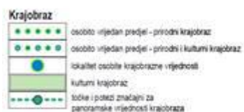
Slika 1. Izvod iz KP. 3.1.UVJETI KORIŠTENJA, UREĐENJA I ZAŠTITE PROSTORA: Područja posebnih uvjeta korištenja PPUŽ Zadarske